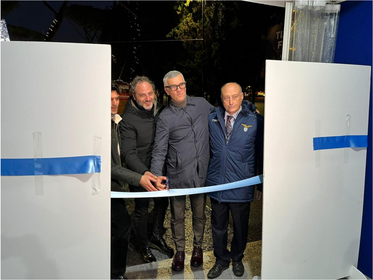
taglio del nastro Roma